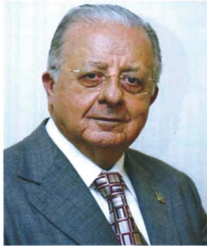
Luiz Lemos Leite Presidente da ANFAC

Na verdade, o fomento mercantil sempre enxergou além de seus interesses próprios, vislumbrando um país com potencial de crescimento, despertando em todas as latitudes do imenso território brasileiro, a latência das capacidades e,