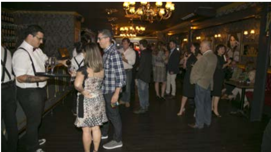
Coquetel de Recepção

Ainda em comemoração aos 25 anos de fundação, fechando o ano, foi oferecido aos associados um Jantar de Confraternização no Burlesque Paris 6 By Night, uma casa de espetáculo que reproduz os famosos espetáculos de dança franceses, bem como apresenta números circenses. O evento foi prestigiado por mais de 300 pessoas.