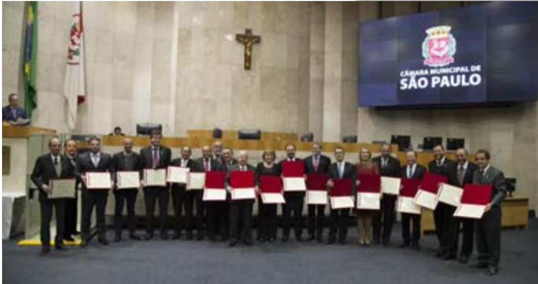
Homenageados pelos 25 anos do SINFAC-SP