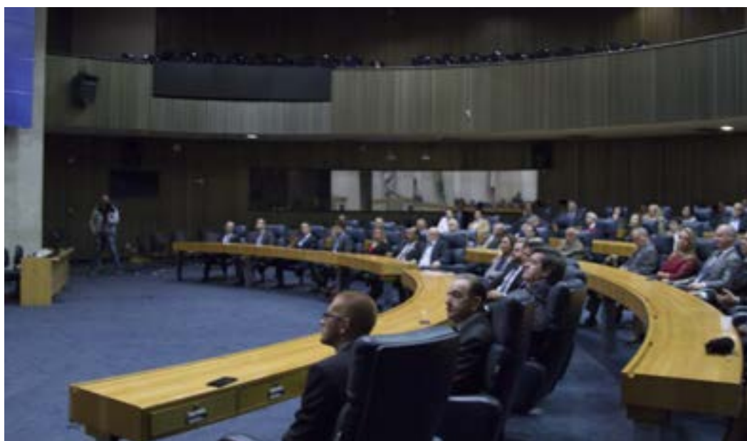
Convidados presentes na Solenidade da Câmara dos Vereadores